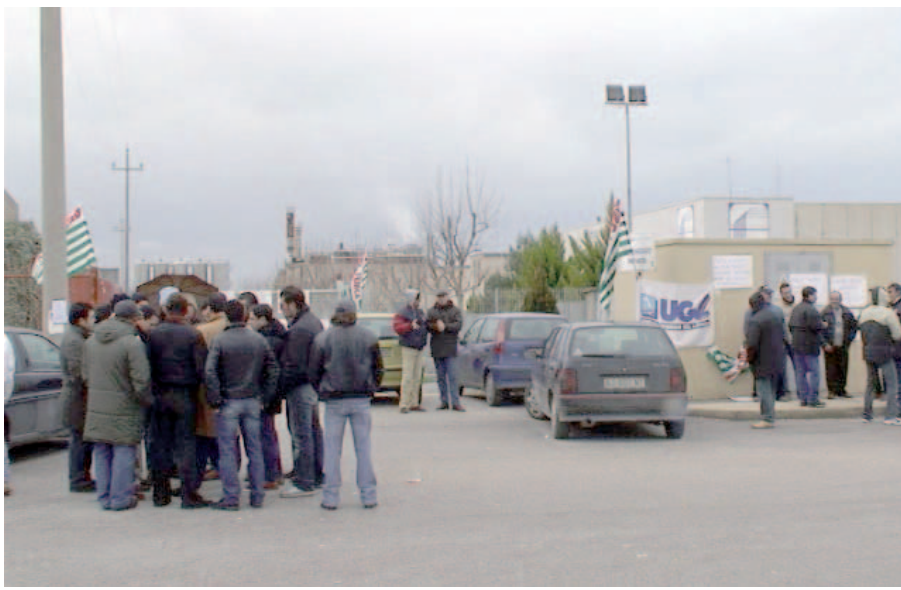
Operai della Franzoni davanti al loro opificio durante un'agitazione per impedire la chiusura