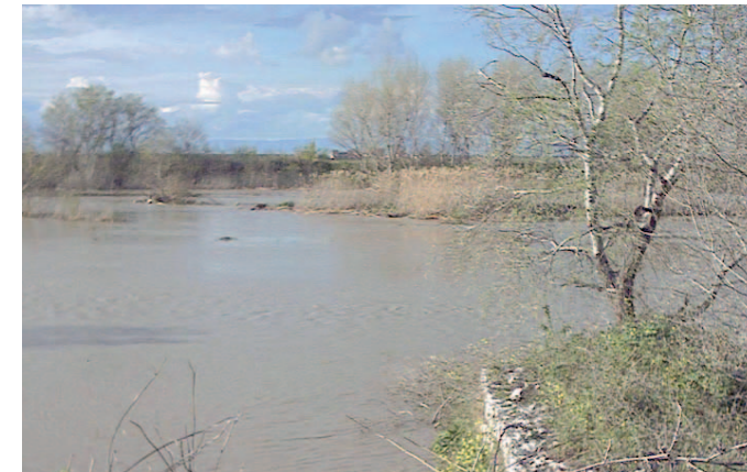
Il fiume Ofanto in piena

● BARLETTA. L'ondata di maltempo dei giorni scorsi ha provocato un'ondata di piena nel fiume Ofanto. L'acqua ha invaso anse e golene anche se è rimasta al di sotto del livello di guardia e ben all'interno degli argini. L'unica nota negativa è che unitamente alla sabbia e al fango trasportati dalla corrente vi sono anche rifiuti di ogni genere soprattutto bottiglie ed altri involucri di plastica che andranno a finire in mare. Insomma al di là della polemica sul parco fluviale l'Ofanto viene ancora utilizzato dai molte persone come una pattumiera.