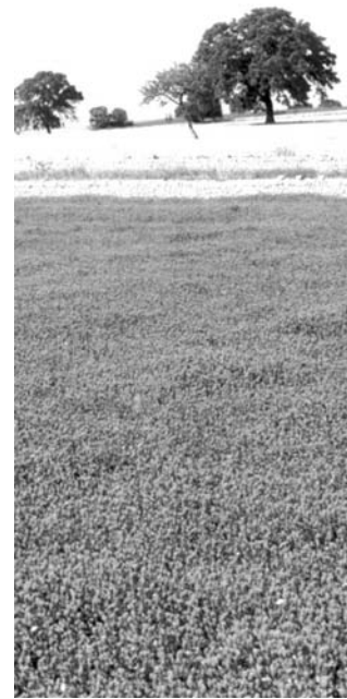
MURGIA. La Puglia per definizione

sempre possibile razionalizzare l'irrazionalizzabile, sfatare il mito, la leggenda, il racconto. Tramortire, mai assassinare, l'alone magico che gravita intorno alla mitologia. Tutto è possibile e, allora, la verità potrebbe essere quella delle leggende. E cioè che siano stati gli dei a creare il mondo, che diavoli e angeli affollino ancora le immensità degli spazi aperti, che le fate esistano. Che il popolo, per secoli, non abbia inventato, ma solo testimoniato. E', questa, la sola eredità dei nostri avi, l'eredità del pensiero, della storia della gente. In questo libro l'autrice ha mescolata