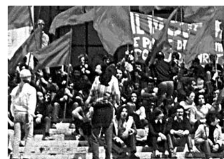
SESSANTOTTO. Storia e miti a Bisceglie

Il workshop sarà un'occasione per esplorare luoghi comuni, pregiudizi e verità di un anno connotato da grandi e controversi movimenti di massa, socialmente disomogenei e di aggregazione spontanea, che attraversarono quasi tutti i paesi del mondo per dare origine a una profonda e radicale trasformazione sociale. Sarà inoltre proiettato il filmato «Bari underground in otto minuti '68-'70» a cura di Mario Fiorentino su alcuni suggestivi eventi del '68 a Bari raccontati sulle note dei più celebri musiche del periodo. Il concerto di Patty Pravo, affascinante icona del sessantotto, si svolgerà invece nell'Arena del Mare di Bisceglie, laddove la cantante veneziana proporrà i più famosi brani del suo repertorio: «La bambola», «Se perdo te», «Pazza idea», «Ragazzo triste», «Pensiero stupendo».