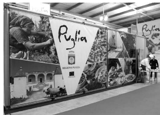
Lo stand della Puglia alla Bit di Milano

«In molti si sono interessati al nostro territorio tra Gargano e Salento»