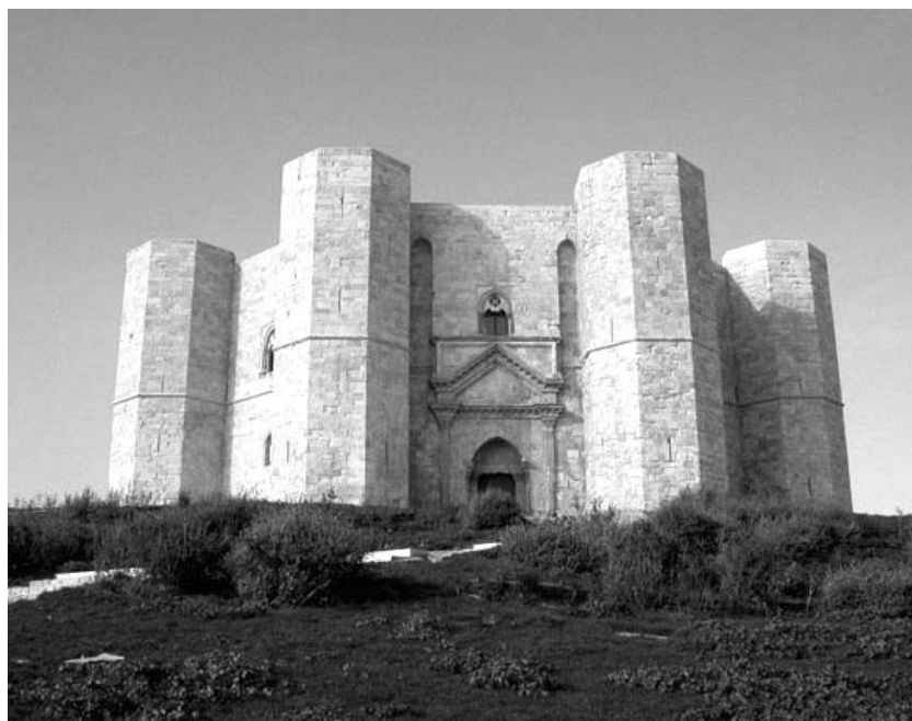
Gettonatissimo Castel del Monte alla Bit

Quello con la Bit è senza dubbio il più prestigioso appuntamento di settore al quale l'Agenzia Puglia Imperiale Turismo partecipa, una manifestazione di respiro internazionale che ha avuto un importante momento pubblico per questo territorio: nella sala conferenze del Padiglione della Regione Puglia, infatti, si è svolta la conferenza stampa di presentazione del tema proposto da Puglia Imperiale, nel corso della quale è stata presentata la nuova brochure istituzionale che promuove il territorio come «prodotto turistico», vero e proprio patrimonio di siti che caratterizzano quest'area rendendola unica nel panorama pugliese e nazionale. Alla conferenza stampa ha preso parte anche l'assessore regionale al Turismo on. Massimo Ostillo, il presidente del Patto