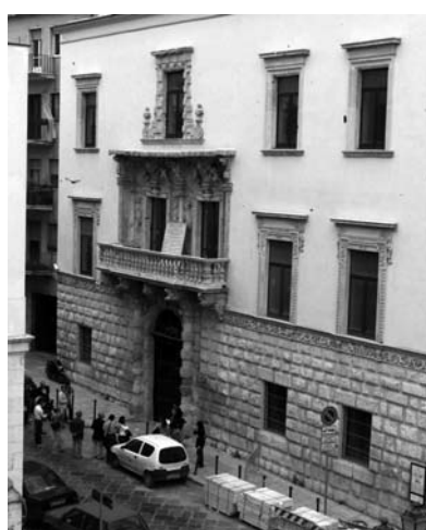
Palazzo della Marra a Barletta