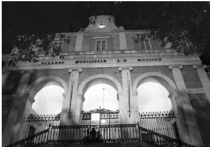
Le decisioni, e le lacerazioni, sulla multiservice cittadina tengono banco sulla scena politica

Multiservice, rilanciati vecchi interrogativi