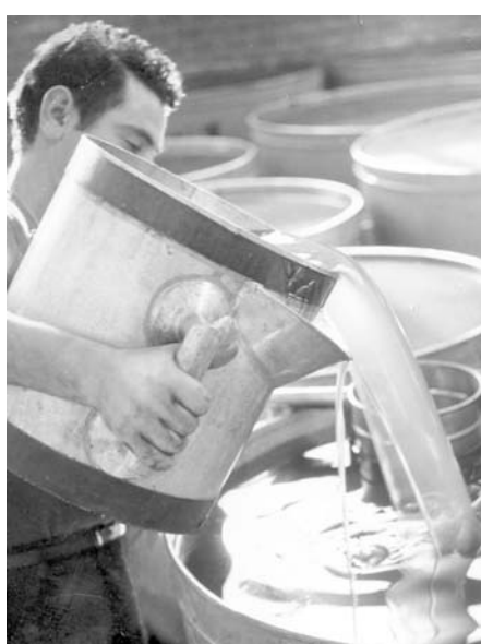
Un gemellaggio nel segno dell'olio extravergine

Siamo vigili e al tempo stesso preoccupati sulla eco-compatibilità e sulla sicurezza delle aziende che intendono insediarsi sul nostro territorio».