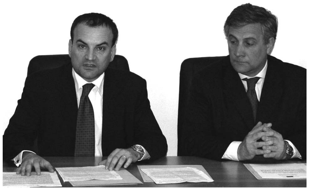
Un momento della conferenza stampa dei deputati europei Vernola e Tajani

Meno chiare appaiono quelle dell'amministrazione comunale di centrosinistra che prima annuncia la difesa del suo territorio contro la discarica e poi rinuncia al ricorso al Tar sugli atti della Regione, come invece ha fatto la cittadina di Poggiorsini.