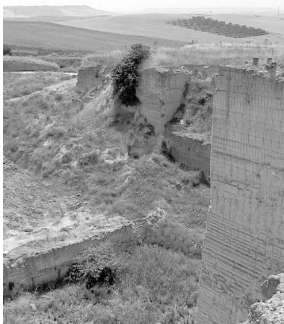
La zona di contrada Grottelline