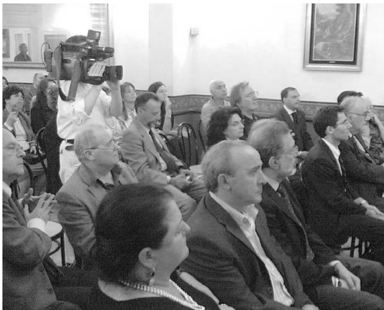
Una delle giornate di studio si è svolta nel circolo culturale «La fenice»

Prossimo obiettivo è la realizzazione del Museo. Su questa strada, infatti, il percorso già efficacemente intrapreso tra Istituzioni ed illustri Rappresentanti, continua con i migliori auspici.