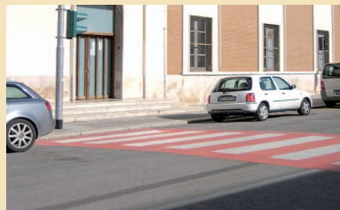
Una delle nuove strisce pedonali

● TRANI. Sono state già installate in diverse zone della città le nuove strisce pedonali. Sono decisamente più durature di quelle disegnate di volta in volta ma hanno comportato anche qualche problema per i residenti nella zona: il materiale utilizzato ha emanato un odore a dir poco sgradevole. Il comandante dei vigili urbani, però, assicura: «Non sono tossiche».