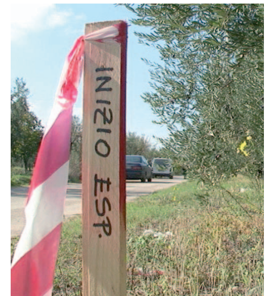
Gli ulivi che rischiano il taglio

● Il presidente della Provincia di Bari ha fatto proprio l'ordine del giorno riguardante il prospetto espianato di ulivi secolari protetti da una legge regionale e si è impegnato ad intervenire presso l'Acquedotto pugliese e la Regione affinché si riduca quanto più possibile l'impatto sulle piante. L'ordine del giorno era stato presentato da diversi consiglieri di maggioranza.