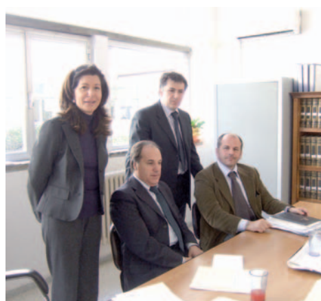
L'incontro al liceo scientifico «Fermi»

L'iniziativa dal titolo «Paulista amore mio» presentata il 16 novembre