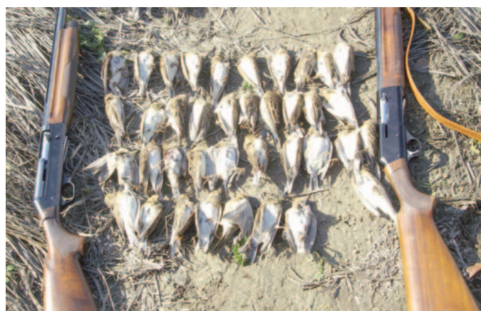
Uno dei fucili sequestrati e parte degli uccelli abbattuti

● SPINAZZOLA. Cacciatori denunciati per l'utilizzo di registratori elettronici. Le denunce sono state inoltrate dalle guardie venatorie del Wwf di Bari.