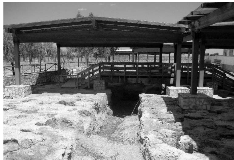
Trinitapoli, gli scavi nella zona archeologica

Questa mattina a Trani viene presentata l'iniziativa