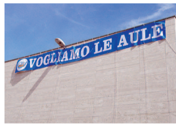
ANDRIA Sos inascoltato