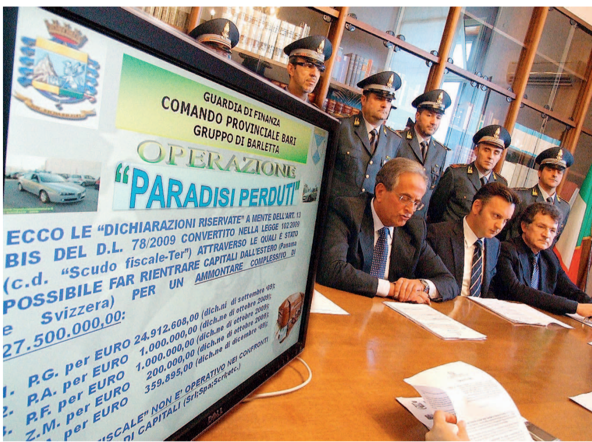
PARADISI FISCALI La conferenza stampa in Procura, a Trani, sull'operazione condotta dalla Finanza a Barletta