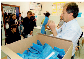
Lo scrutinio in un seggio

ANDRIA ANCORA SENZA RISPOSTA LE DOMANDE SULL'AVVIO DEI LAVORI