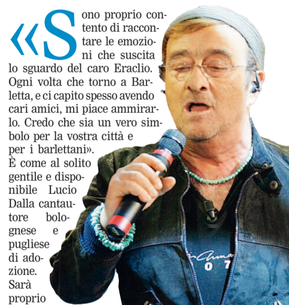
LA STATUA LA MUSICA A destra Eraclio accanto al cantante Lucio Dalla